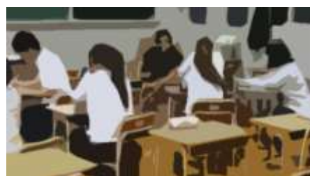
ソーシャルスキル講座