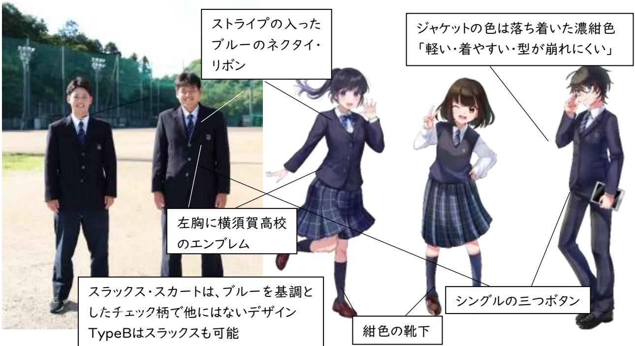
キャラクターイラスト作成：ルネサンスデザイン・美容専門学校