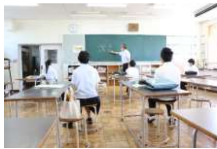
少人数授業で質問もしやすい